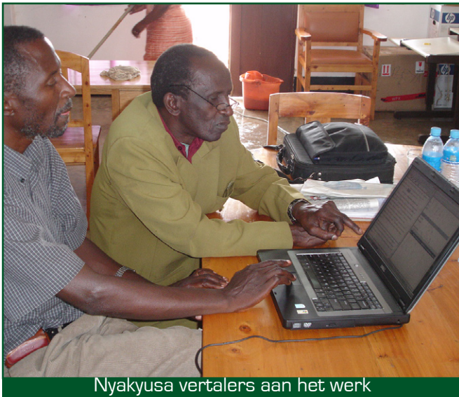
Nyakyusa vertalers aan het werk